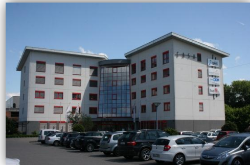
Unsere Geschäftsräume im CASA Alzenau

Die GNS GmbH ist seit 19 Jahren als IT-Systemhaus tätig und arbeitet bundesweit mit Kunden jeder Größe und aus unterschiedlichen Branchen zusammen. Seit der Gründung ist die GNS GmbH in den Bereichen Entwicklung, Betrieb und Support von IT-Lösungen tätig und hat über die Jahre ein enormes Wissen aufgebaut. Mit den Schwerpunkten in der Systemintegration für Windows-Netzwerke, in der Desktop- und Server-Virtualisierung sowie dem Anwender- und Infrastruktur-Support bietet die GNS GmbH ein Produktportfolio, das dem Kunden einen enormen funktionalen und wirtschaftlichen Nutzen bietet. Seit 2014 hat die GNS GmbH ihren Firmensitz in Alzenau